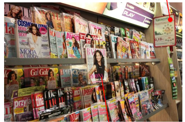
Nowość: ekspozytor przestrzenny na tytuł