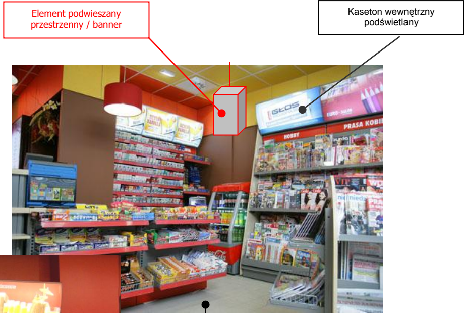
Element podwieszany przestrzenny / banner